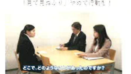
パワハラ相談対応者は、「企業のパワハラ相談対応者の具体的な対応」の例