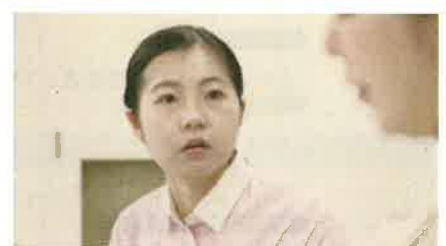
周囲の人がハラスメントに気づいて止める「見て見ぬふり」を改めて行動を！