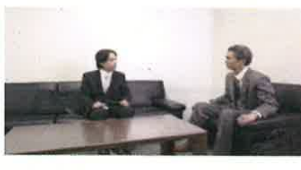
仕事の上で叱るとは、どのように叱ればよいのでしょうか？ 上級レベル