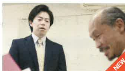
動画で学ぶ「パワハラの育休休業取得等ハラスメント」