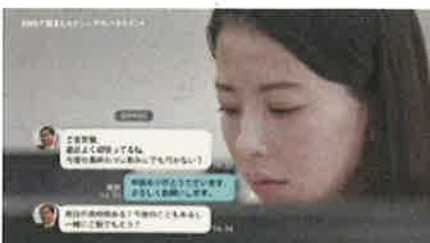
SNSで話題になったカジュアルハラスメント