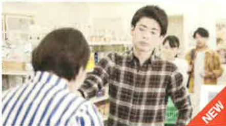
動画で学ぶ「カスタマーハラスメント」

職場のハラスメントを理解し、予防・解決に役立つ動画が、検索できるようになりました。項目はパワハラ「6類型」、パワハラを回避するための「指導」動画、パワハラ相談対応者の対応の仕方をまとめた「相談」動画、セクハラ解説動画、マタハラ解説動画の10項目から。社内研修での視聴にも、ご活用ください。